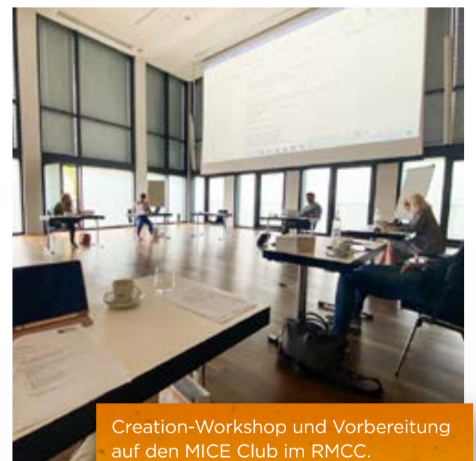
Creation-Workshop und Vorbereitung auf den MICE Club im RMCC.

Die besondere Idee dahinter: offene Dialoge auf Augenhöhe im Rahmen von familiären Gruppendiskussionen und auf Mehrwert fokussierte Methoden fördern neue Wege der Produktvermittlung mit dem Ziel, einen konkreten Return on Investment für Anbieter und Planer gleichermaßen zu erreichen! Das Schwerpunktthema des dreitägigen Workshops,